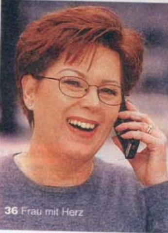
36 Frau mit Herz

Telefonisch mobil sein ist eine feine Sache. Für Senioren kann ein Handy in Notfällen sogar Sicherheit bieten. Doch wie soll man bei all dem technischen Schnickschnack