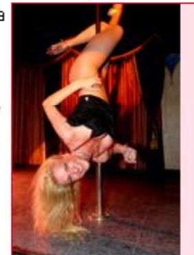
Für Senioren gibt es im „Table Dance“ eine Sondervorstellung.

Die Senioren-Sonder-Vorstellung beginnt am Sonntag um 16 Uhr. Und warum macht der Club das? Thiel: „Man hört so viel von Rentenkürzungen und sonstigen Hiobsbotschaften für unsere Senioren – da wollen wir mal ein Zeichen von Lebensfreude setzen. Man muss doch auch mal ein bisschen Spaß haben.“