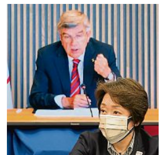
OK-Chefin Hashimoto und IOC-Boss Bach

(24. August bis 5. September) Spielen reisen sollen. Demnach sollen nur rund 94 000 Menschen (Sportler, Funktionäre und Medienvertreter) aus dem Ausland nach Tokio kommen, ursprünglich waren 200 000 erwartet worden.