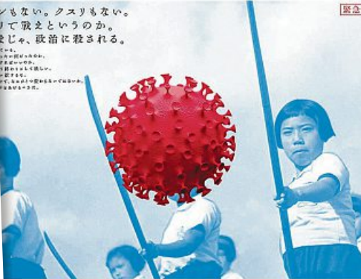
Links Japans Ex-Premier Abe 2016 in Rio als Super-Mario, oben das modifizierte Propaganda-Poster von 1940